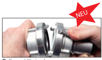
Option: mit Verriegelung